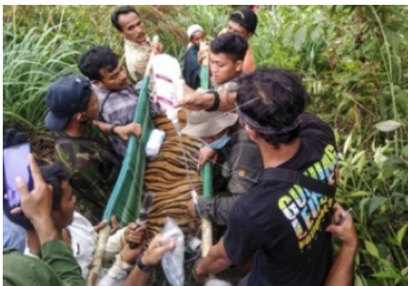
Foto 2. Petugas BKSDA Mengevakuasi Harimau Sumatra

Caption: Tim gabungan Balai Konservasi Sumber Daya Alam (BKSDA) Aceh memikul anak Harimau Sumatra ( Panthera Tigris Sumatrae ) yang terkena jerat di Desa Gulo, Darul Hasanah, Aceh Tenggara, Aceh.